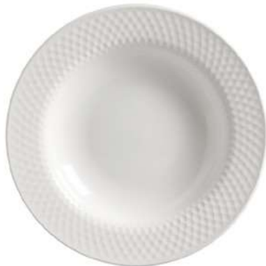
1243-302 Conj. de Pratos Fundos 3,5xØ25 cm 6 peças