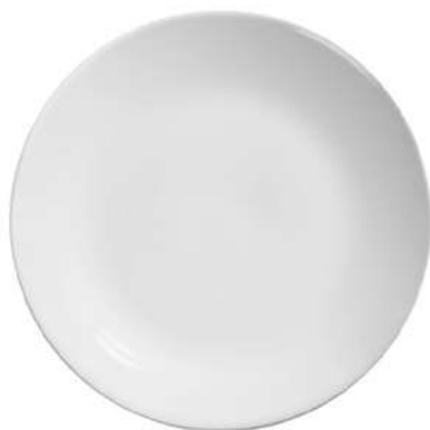
1076-201 Conj. de Pratos Rasos Coup 2,5xØ29 cm 6 peças