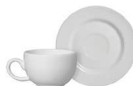
1076-105 Conj. Xícaras de Café c/ pires Xícara: 9,5x7x4,5 cm - 85ml Pires: Ø12x1,5 cm 6 peças