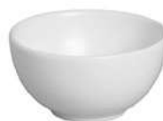
7500-106 Conj. de Bowl Slim Branco Pérola 6xØ12,5 cm - 350ml 6 peças