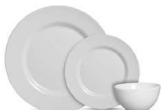
Aparelho de Jantar 12 peças: 1076-003 (4 pratos rasos, 4 pratos de sobremesa, 4 bowls)