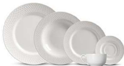
Aparelho de Jantar 20 peças: 1243-001 (4 pratos rasos, 4 pratos fundos, 4 pratos de sobremesa, 4 xícaras de chá e 4 pires de chá)