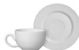
1096-105 Conj. Xícaras de Café c/ pires Xícara: 9,5x7x4,5 cm - 85ml Pires: Ø12x1,5 cm 6 peças