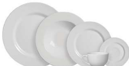
Aparelho de Jantar 20 peças: 1076-001 (4 pratos rasos, 4 pratos fundos, 4 pratos de sobremesa, 4 xícaras de chá e 4 pires de chá)