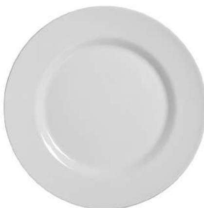
1076-101 Conj. de Pratos Rasos 2,5xØ29 cm 6 peças