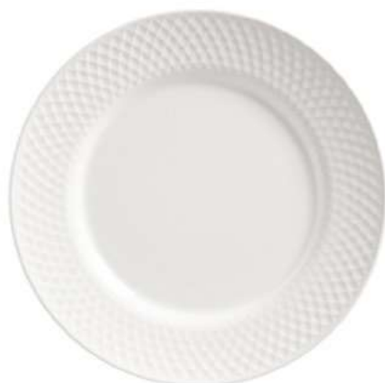
1243-301 Conj. de Pratos Rasos 2,5xØ29 cm 6 peças