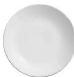
1076-203 Conj. de Pratos Sobremesa Coup 2,0xØ21 cm 6 peças