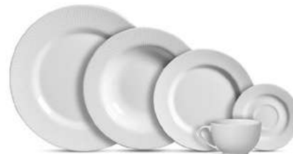
Aparelho de Jantar 30 peças: 1096-006 (6 pratos rasos, 6 pratos fundos, 6 pratos de sobremesa, 6 xícaras de chá e 6 pires de chá)