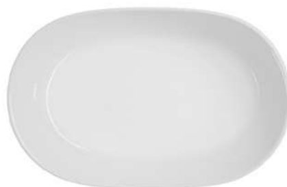
1076-122 Travessa 34x22cm 1 peça