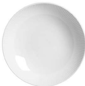
1096-118 Conj. de Pratos Fundos Coup 3,5xØ25 cm 6 peças