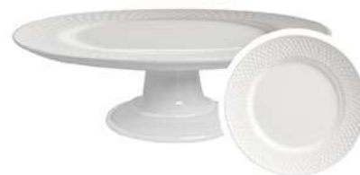
1243-116M Boleira c/ Pé 11,5xØ29 cm 1 peça