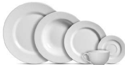
Aparelho de Jantar 20 peças: 1096-001 (4 pratos rasos, 4 pratos fundos, 4 pratos de sobremesa, 4 xícaras de chá e 4 pires de chá)