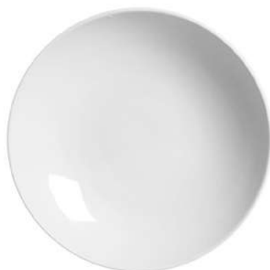
1076-118 Conj. de Pratos Fundos Coup 3,5xØ25 cm 6 peças