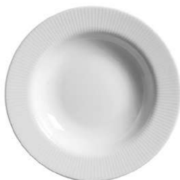
1096-102 Conj. de Pratos Fundos 3,5xØ25 cm 6 peças