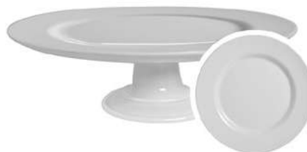
1076-116M Boleira c/ Pé 11,5xØ29 cm 1 peça