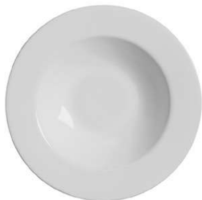
1076-102 Conj. de Pratos Fundos 3,5xØ25 cm 6 peças