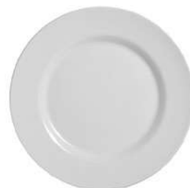
1076-103 Conj. de Pratos Sobre mesa 2,0xØ21 cm 6 peças