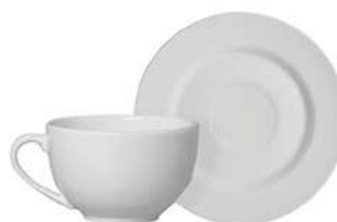
1096-104 Conj. Xícaras de Chá c/ pires Xícara: 13x10x6,5 cm - 250ml Pires: Ø15,7x2,1 cm 6 peças