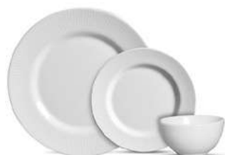
Aparelho de Jantar 12 peças: 1096-003 (4 pratos rasos, 4 pratos de sobremesa, 4 bowls)