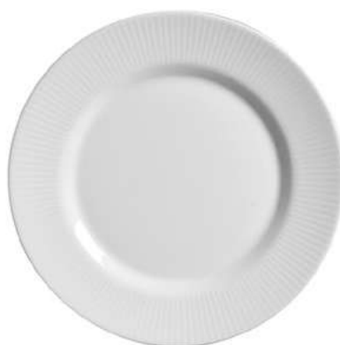
1096-101 Conj. de Pratos Rasos 2,5xØ29 cm 6 peças