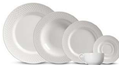
Aparelho de Jantar 30 peças: 1243-006 (6 pratos rasos, 6 pratos fundos, 6 pratos de sobremesa, 6 xícaras de chá e 6 pires de chá)