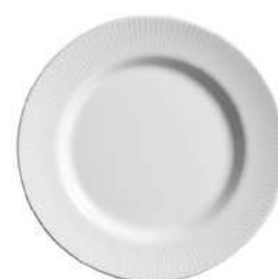
1096-103 Conj. de Pratos Sobremesa 2,0xØ21 cm 6 peças