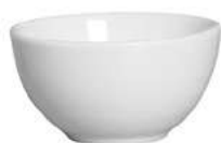
0002-106 Conj. de Bowl Branco Neve 6xØ12,5 cm - 350ml 6 peças