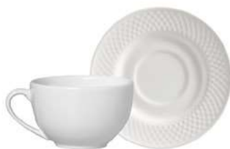
1243-304 Conj. Xícaras de Chá c/ pires Xícara: 13x10x6,5 cm - 250ml Pires: Ø15,7x2,1 cm 6 peças