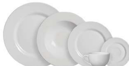
Aparelho de Jantar 30 peças: 1076-006 (6 pratos rasos, 6 pratos fundos, 6 pratos de sobremesa, 6 xícaras de chá e 6 pires de chá)